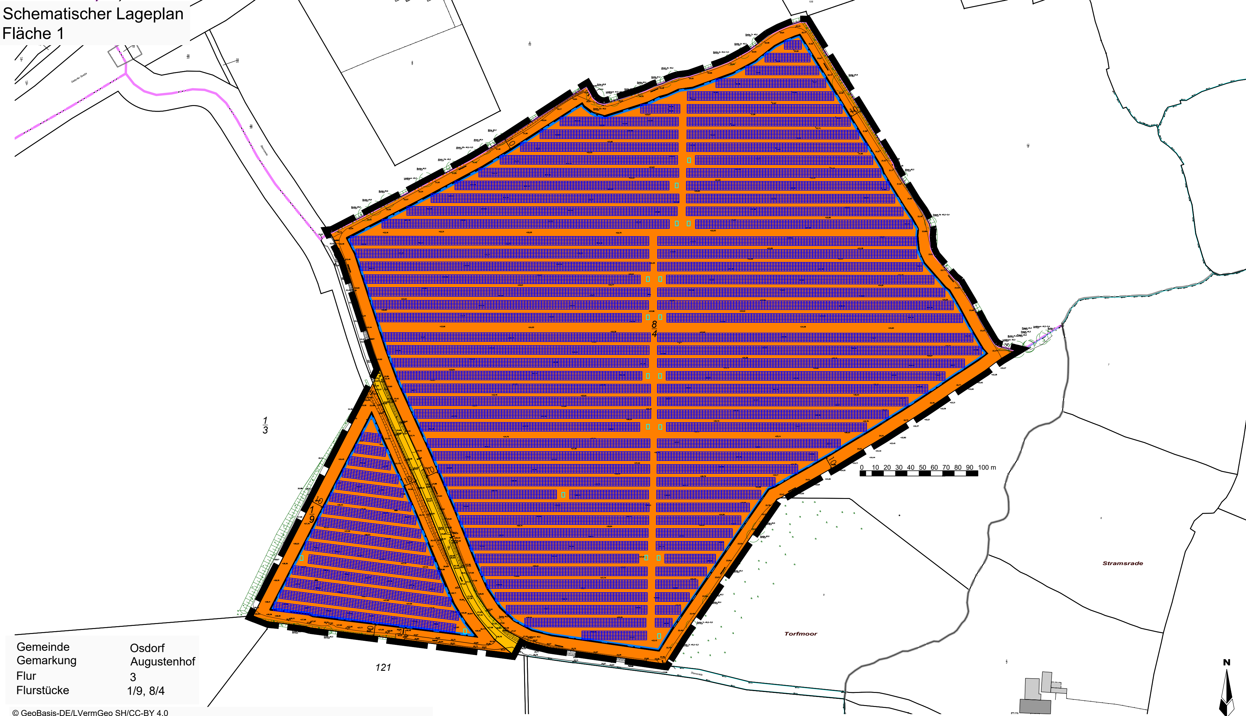
Schematischer Lageplan Fläche 1

für das Gebiet südlich der Ortslage Osdorf zwischen Kreisstraße K49 und der Bundesstraße B76, sowie östlich der Landesstraße L44 der Gemeinde Osdorf